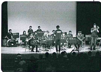
IDEA Wind Orchestra