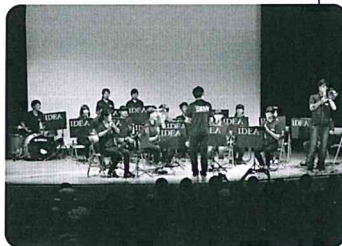
IDEA Wind Orchestra